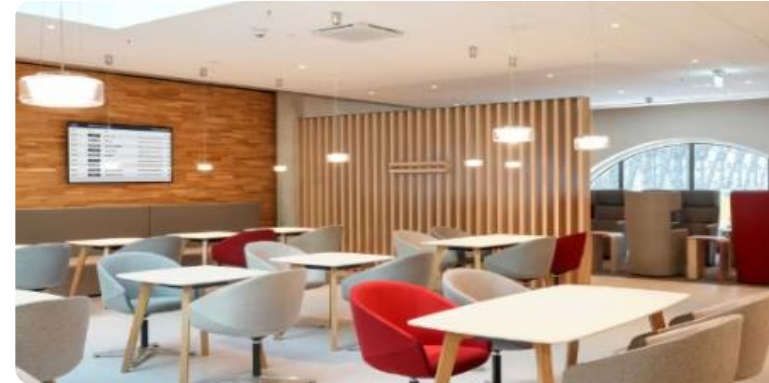
DB Lounges 1)