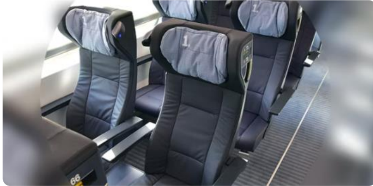
Sitz- und Raumkomfort, Ruhezeiten