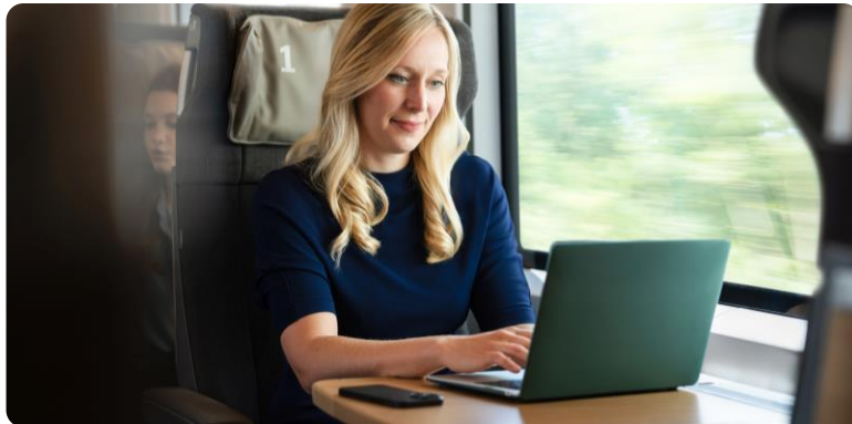
ICE-Portal mit Komfort Check-in und WLAN Service