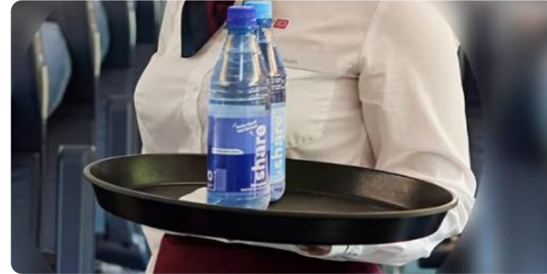
Service am Platz